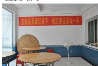
晚饭后19:00，餐桌、地面已被阿姨收拾得干干净净，井然有序。