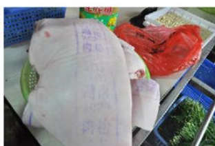
食堂所用猪肉均为检验合格且盖有钢印