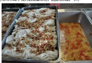
早晨6点15分，食堂师傅们就开始为大家准备早餐，7点，鲜美早点已经做好了

他们每天重复着洗菜、炒菜、打扫卫生等工作，琐碎而平淡，炎炎夏日，他们在锅炉旁忍受着高温烹制美味佳肴，寒冬腊月，他们的双手浸泡在冷水里清洗着锅碗瓢盆。食堂工作，也许是简单而平凡的，然而却是十分需要毅力和耐心的工作，要求不怕脏不怕累。平均每餐近200人吃饭，工作量实在不小，常常会忙得腰酸背痛，然而每一次来吃饭时，我们看到的却是打饭阿姨和厨师们热情的笑脸。食堂员工，平凡而可贵，是他们的用心工作保障了我们的健康生活，这是他们的一天：