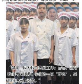
“完美，因为我们的后勤工作，简单，但因为我们用心经营，我们的一句‘好吃’，是我们最大的欣慰。”

编者语：我们无法亲眼目睹他们辛劳的一天，但此时却为那份勤劳的心意感动不已。放眼于富基集团的各个部门每位员工，何尝不是在各自的工作岗位上为富基理想大厦添砖加瓦？即使工作内卷千篇一律，工作环境艰苦恶劣，但只因心怀同样的理想，所以风雨无惧的坚持着，愿每一位富基人，心怀富基梦，乐享工作情，一起在平凡的岗位上做出不凡的事业。