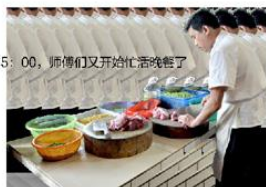
15:00，师傅们又开始忙活晚餐了