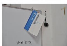
我们可以在意见簿上写上建议，比如想吃的菜、建议取消的菜等等。