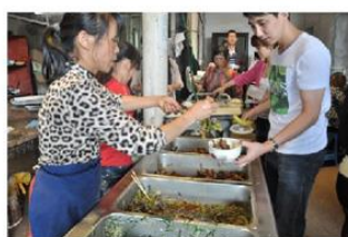
中午吃土豆烧排骨，甜甜的粉粉的，四菜一汤，营养丰富。总有几个食堂的忠实粉丝从一开始吃到最后，然后感叹一句，唉，又长胖了。