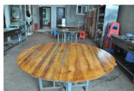
操作区域清理干净了，他们的用心，让我们吃得放心。