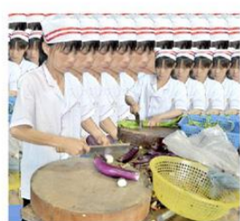
阿姨熟练地切着菜，看上去只是一个小小的动作，一天下来手腕酸痛难忍。