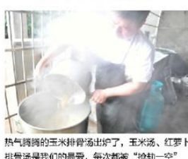
热气腾腾的玉米排骨汤出炉了，玉米汤、红萝卜排骨汤是我们的最爱，每次都“抢劫一空”